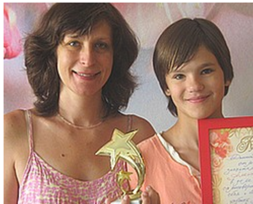
Работа в "Успешном старте" пошла нам на пользу.

Никто не создаст нашим детям то, в чём истинно они нуждаются, для этого требуется более активное участие самих родителей.